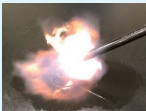
■ ガスマッチによる爆発 (P435, 写真 7)