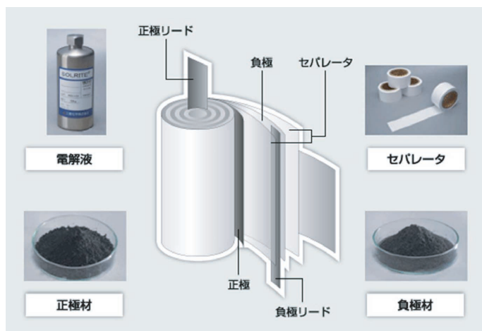
図5 リチウムイオン電池の電極構造

吉野彰, モバイル機器を支える電池—これからも世界を変えるリチウムイオン電池—, 化学と教育 2018, 66, pp 296-299.