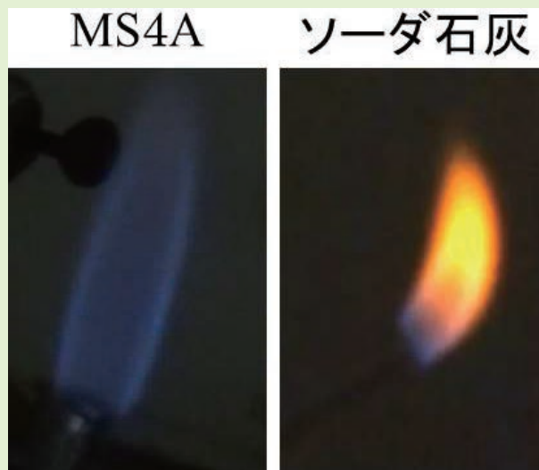
■発生した気体の燃焼*** (P499, 図 8) イソブテンを多く含むソーダ石灰からの生成物では、黄色の炎が観察される。