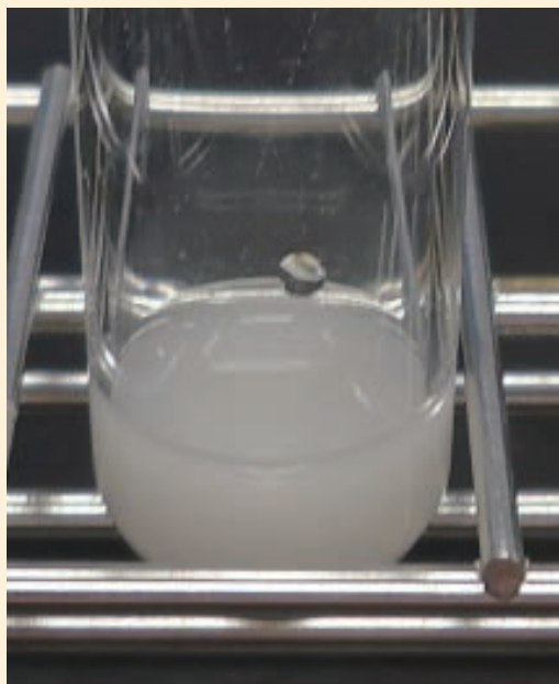
■ 塩化銀の白色沈殿 (P461, 写真 2)