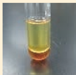
写真6 ポリスチレンの熱分解