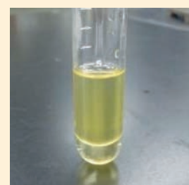
写真7 攪拌後下層の赤褐色が消失する