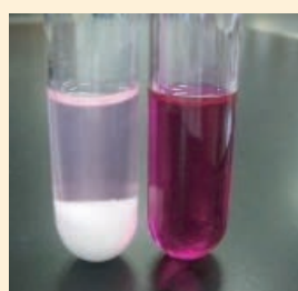
写真4 フェノールフタレイン溶液を加えて比較

試験管内の残留物を別の試験管にとり、水に対する溶け方を調べる。同様に加熱前の炭酸水素ナトリウムとの溶け方を比較する。