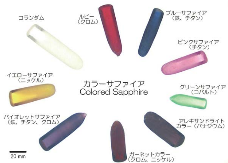
図1 各種カラーサファイアの写真 (括弧内はドーパント種類)。