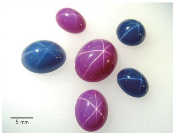
図3 カボションカットのスタールビーと スターサファイア (いずれも人工宝石)。