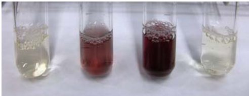
図8 市販の香料を用いた呈色反応の結果。 (左からオレンジ，ストロベリー，メロン，レモンの各香料。)