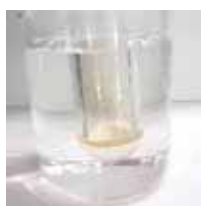
写真 2 お湯で加熱する