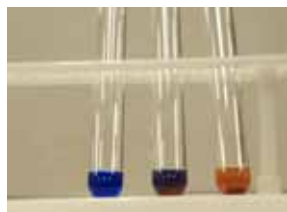
写真4 糖類の結果 グルコース(右), マルトース (中央), スクロース(左)