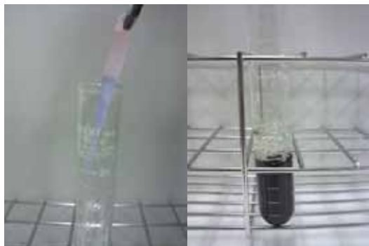
図1 実験1の結果<color> (左)操作 , (右)操作