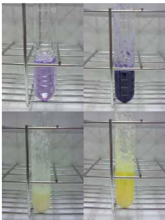
図3 実験3の結果<color> (左上)操作 , (右上)操作 , (左下)操作 加熱後 , (右下)操作 完了時